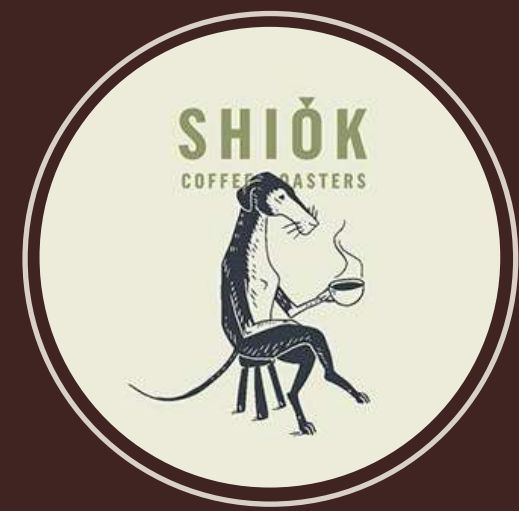
SHIOK COFFEE ROASTERS