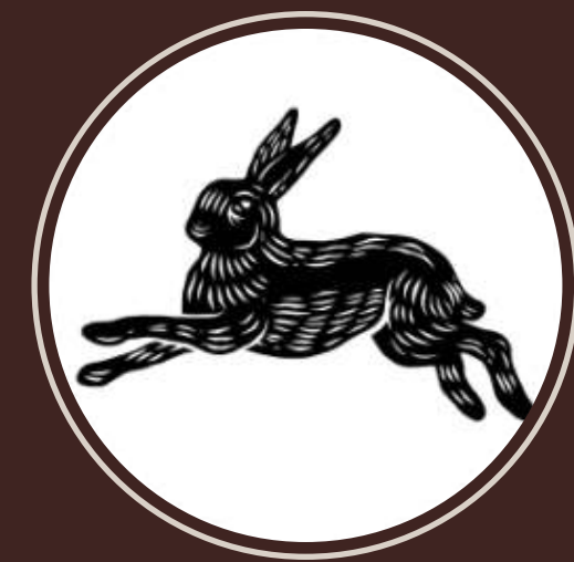
BOSQUE GROW CAFÉ