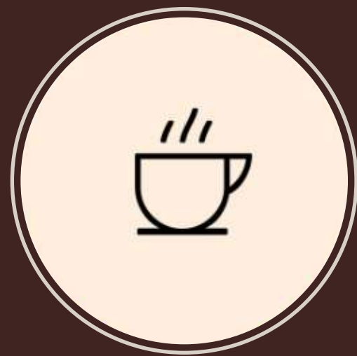
LE DUREAU CAFÉ

PARA QUE PODAMOS CHARLAR Y TRABAJAR EN EQUIPO COMUNICÁTE CON NOSOTROS