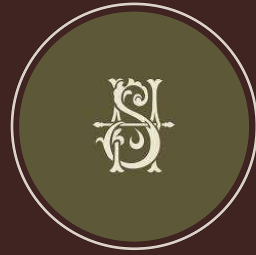
SELAH REFUGIO DE CAFÉ